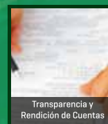
Transparencia y Rendición de Cuentas