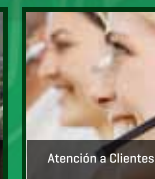
Atención a Clientes