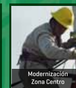
Modernización Zona Centro